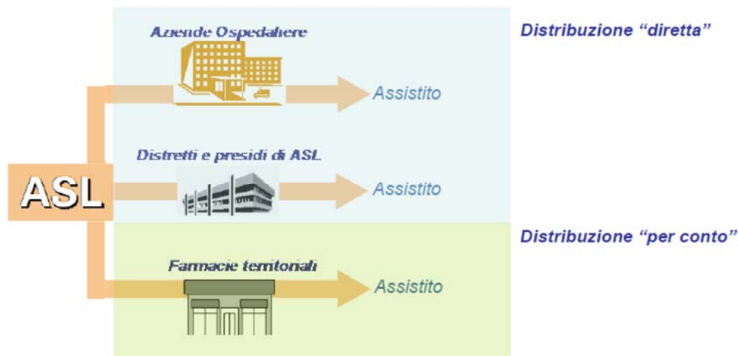
Figura 2 - Modelli organizzativi della distribuzione (diretta/per conto) [D24]

nazionale – siano identificati indirettamente mediante il codice identificativo dell’Azienda Sanitaria di riferimento.